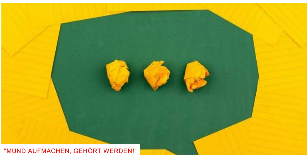
"MUND AUFMACHEN, GEHÖRT WERDEN!"

Offene Jugendarbeit: Achammer steht Rede und Antwort