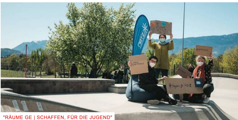
"RÄUME GE | SCHAFFEN, FÜR DIE JUGEND"

Team K: "Jetzt braucht die Jugend Unterstützung"