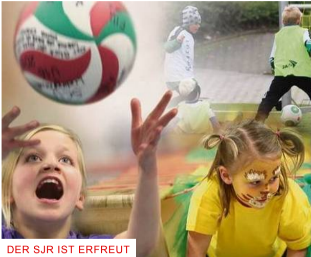
DER SJR IST ERFREUT

"Endlich Vereinsleben in Präsenz möglich"