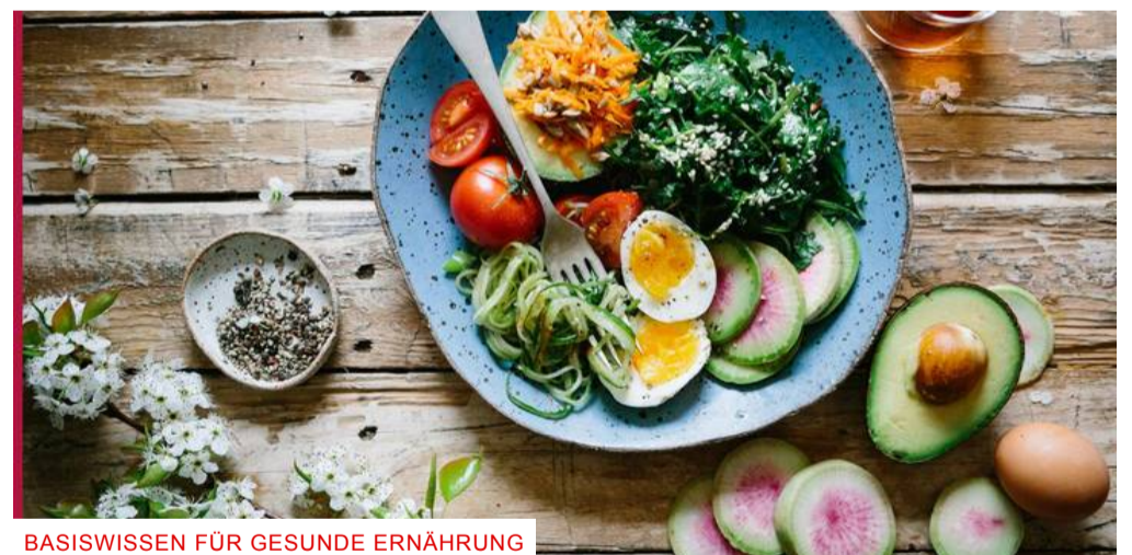
BASISWISSEN FÜR GESUNDE ERNÄHRUNG

Offene Jugendarbeit begeht südtirolweiten Aktionstag