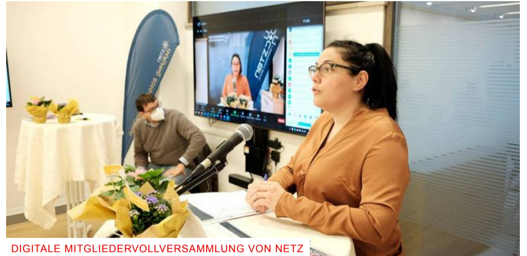
DIGITALE MITGLIEDERVOLLVERSAMMLUNG VON NETZ

"Endlich Vereinsleben in Präsenz möglich"