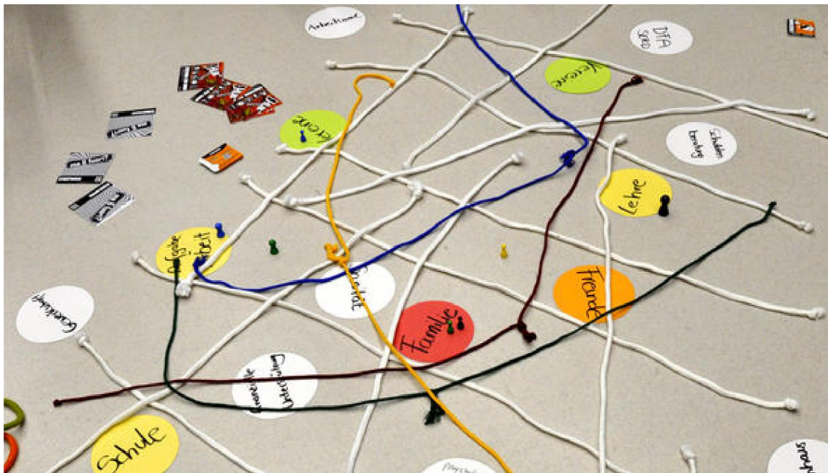
Arbeit im Netzwerk