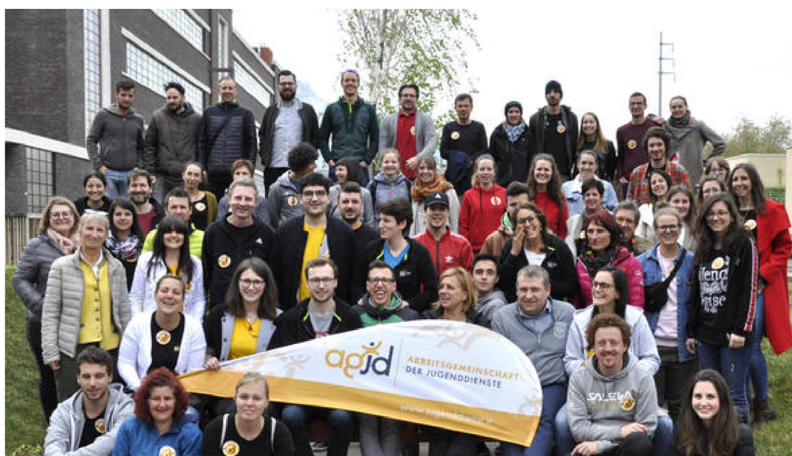
Frühjahrstagung der Jugenddienste

An der Frühjahrstagung der Jugenddienste nahmen über 60 Fachkräfte der Jugenddienste aus ganz Südtirol teil. Organisiert wurde diese ganztägige Fachtagung von der Arbeitsgemeinschaft der Jugenddienste (AGJD), welche die Jugenddienste zu einem Netzwerk zusammenschließt. Passend zum Veranstaltungsort – dem NOI TECHPARK – standen die Themen Innovation und Netzwerken im Mittelpunkt der Tagung - verbunden mit verschiedenen Schwerpunktthemen der Jugenddienste.