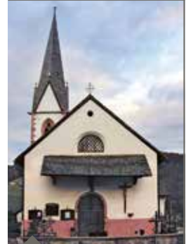
Restauration - Pfarrkirche Hafling